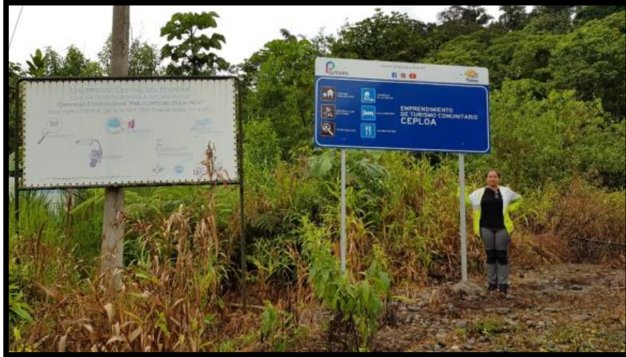
ANEXO 4.- Ingreso a la Comunidad de C.E.P.L.O.A y la E.C.A.J.J.K