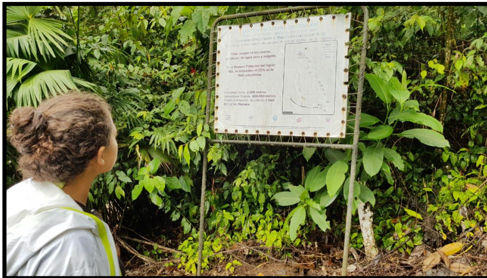
ANEXO 5.- Ingreso al sendero de la Comunidad de C.E.P.L.O.A.