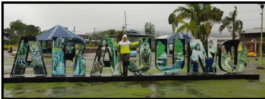
ANEXO 3.- Visita de campo al Cantón Arajuno, Provincia de Pastaza