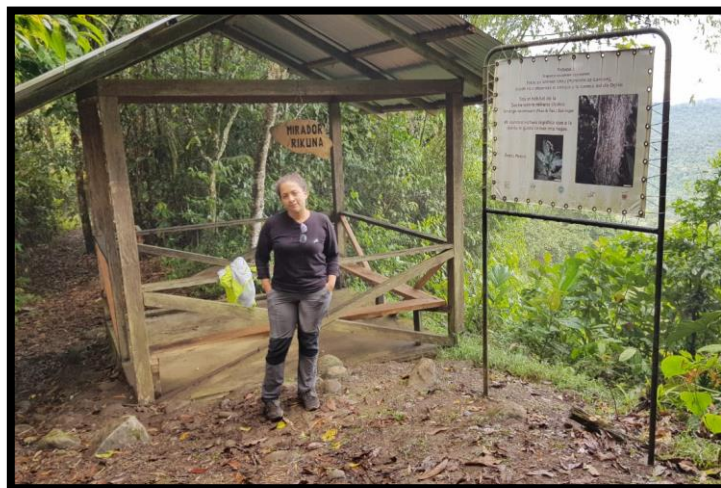
ANEXO 6.- Parada 1 del sendero hacia C.E.P.L.O.A.