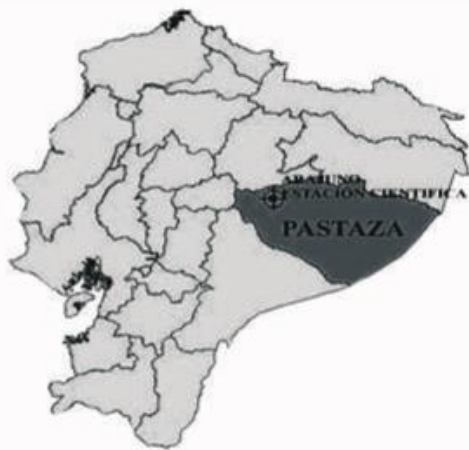
Figura 1. Ubicación de la Estación Científica Juri Juri Kawsay