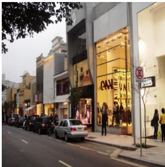
Foto: Rua Oscar Freire Anexo No 10