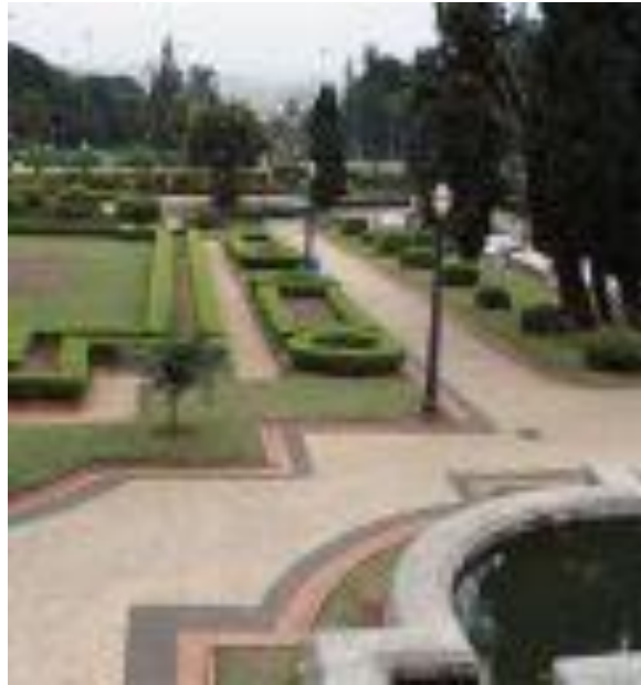
Foto: Jardines del Museo de Ipiranga