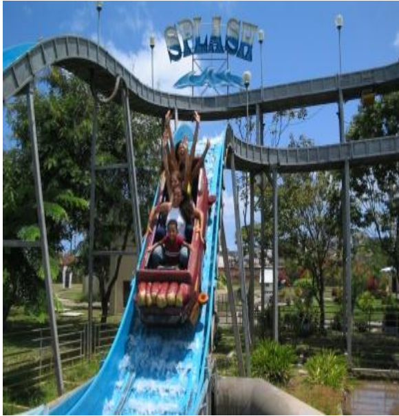
Foto: Parque temático Hopi Hari Anexo No 13