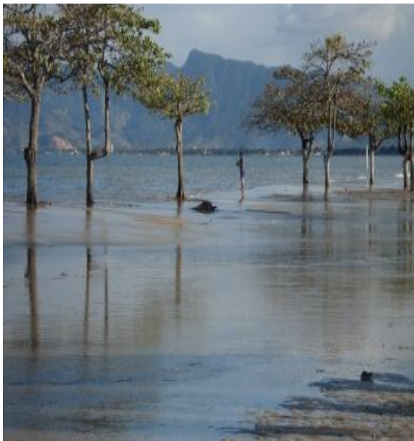
Foto: Praia Central de Caraguatatuba Anexo No 15