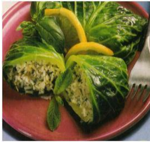
Foto: Col sazónada con carne de puerco Anexo No 6.