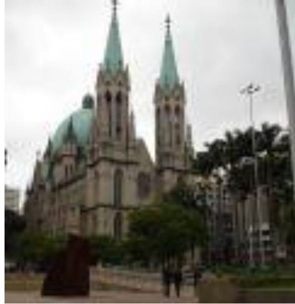
Anexo No 14