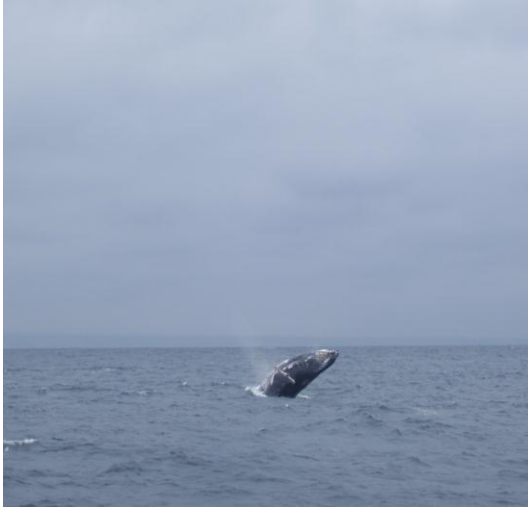
Foto: Apareamiento de las ballenas jorobadas Anexo No 26