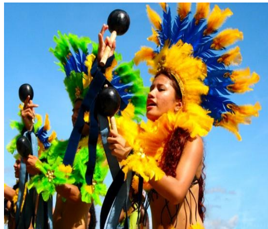
Foto: Fiestas de Parintins Anexo No 4.