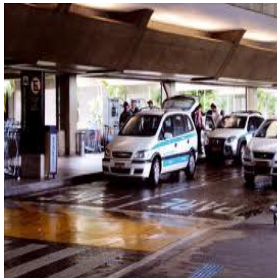
Fotos: Cooperativa de taxi que funciona en el aeropuerto de Guarulhos