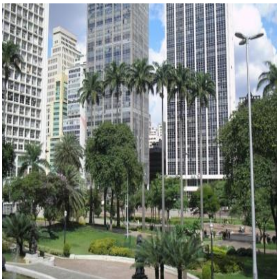
Foto: Vale do Anhangabaú Anexo No 9