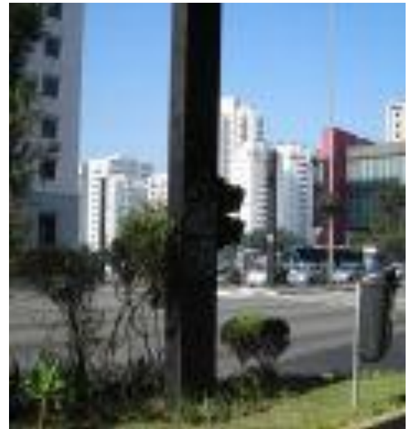
Museo de Arte de São Paulo Anexo No 16