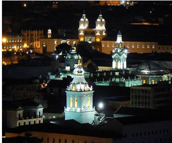
Foto: Centro Histórico de la ciudad de Quito