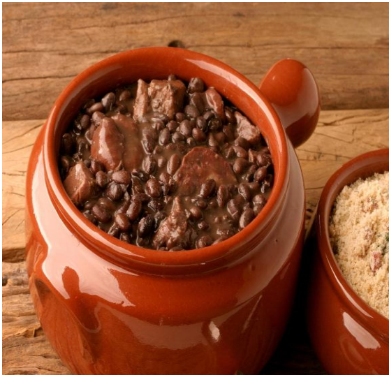
Foto: Combinación de frijoles Anexo No 7.