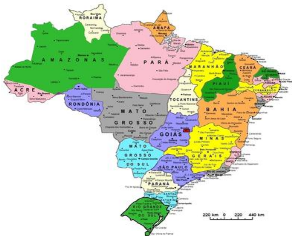
GRAFICO DIVISIÓN ADMINISTRATIVA DE BRASIL