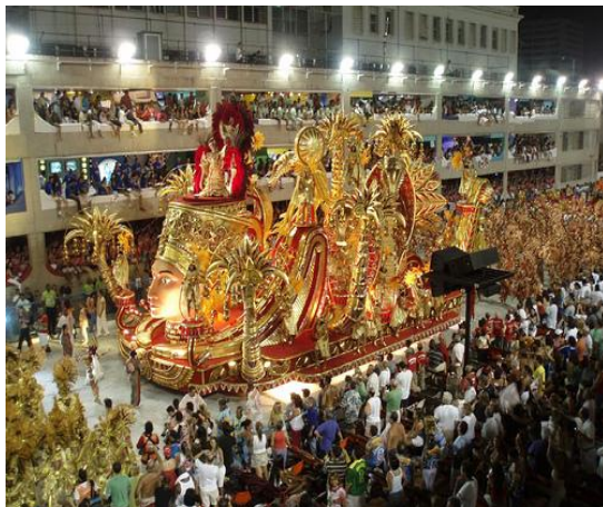
Foto: desfile de carnaval de rio de janeiro Anexo No 3.