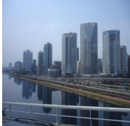
Vista panorámica de la ciudad de São Paulo