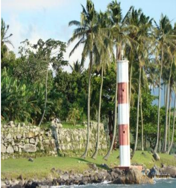
Foto: Faro de Ilhabela