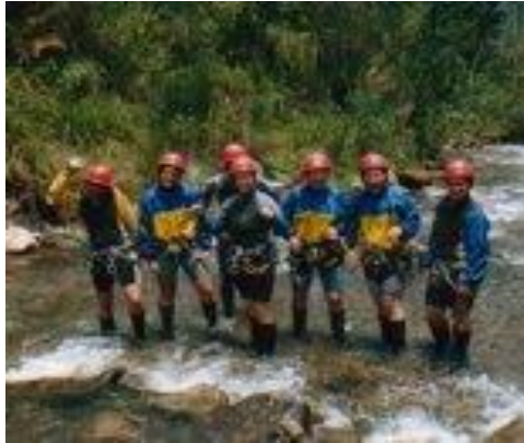
Figura 4.- Canyoning en Baños