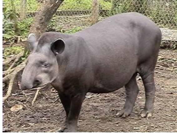
Figura 10.- Eco-zoo San Martín