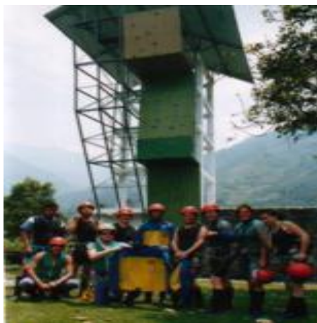
Figura 6.- Escaladas en roca o pared artificial