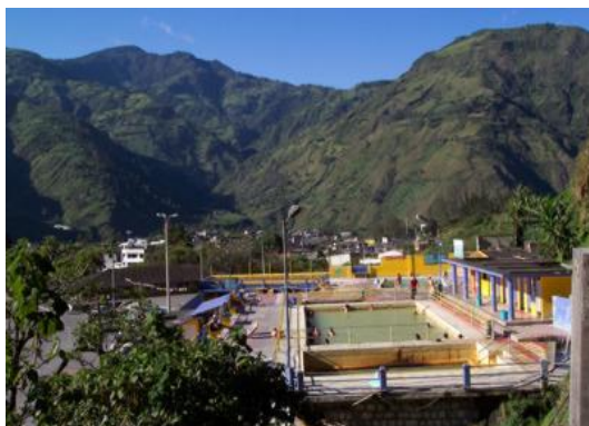
Figura 1.- Aguas Termales