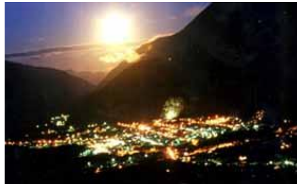
Figura 11.- Vida Nocturna en Baños