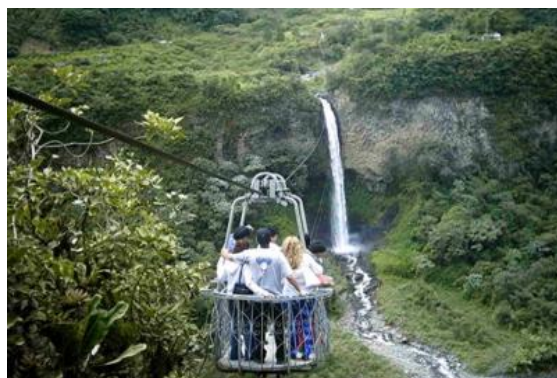
Figura 2.- Tour por las cascadas