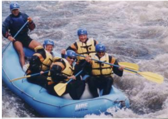
Figura 7.- Rafting en el río Patate y Pastaza