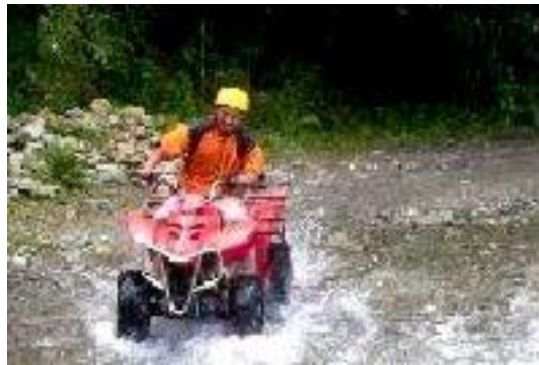
Figura 5.- Cruadrones