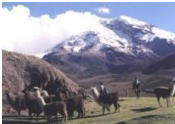
Figura 9.- Trekking y montañismo