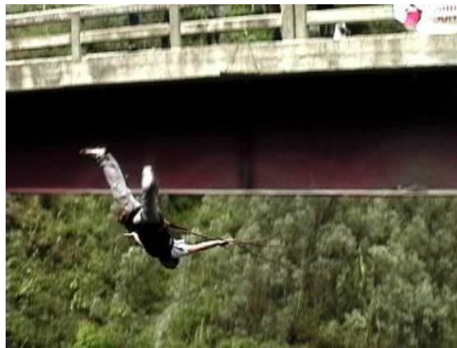
Figura 8.- Salto libre desde puentes